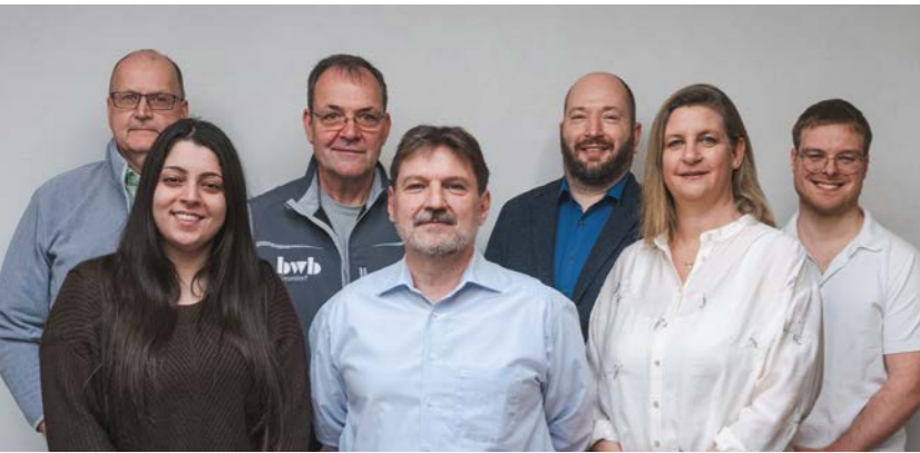
Die Teammitglieder für unsere Wohnobjekte in der Lönssiedlung (D-Stockum) und der Fritz-von-Wille-Straße (D-Rath) betreuten 2025 wichtige Sanierungs- und Modernisierungsmaßnahmen. Hausmeister von D-Stockum abwesend.

und Sorgfalt wahr. Ihre kontinuierliche und engagierte Tätigkeit trägt nachhaltig dazu bei, das Gemeinschaftsgefühl zu stärken und ein konstruktives Miteinander innerhalb der Nachbarschaft zu fördern. Dadurch leisten sie einen wesentlichen Beitrag dazu, die Wohnanlagen nicht nur als Wohnraum, sondern auch als aktive und unterstützende Gemeinschaften zu gestalten.