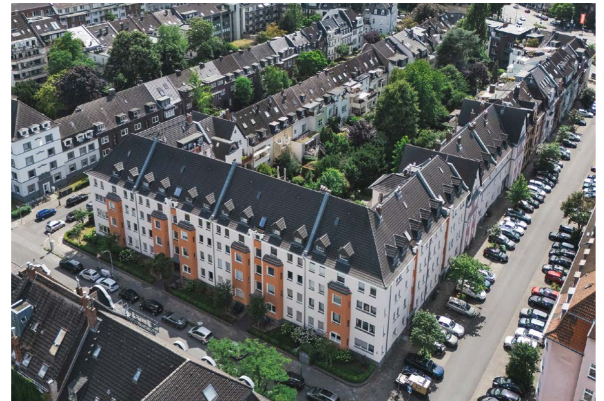
Lützow-, Schwerin-, Rolandstraße