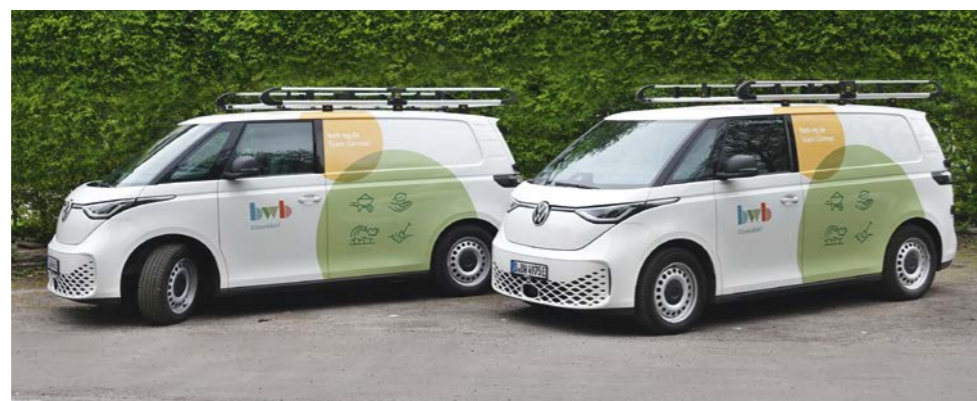
Unsere Firmenwagen fahren elektrisch.

Auch in Düsseldorf-Rath modernisieren wir unseren Bestand: In der Fritz-von-Wille-Straße sanieren wir seit Sommer 2022 insgesamt 144 Wohnungen in 18 Mehrfamilienhäusern aus den 1960er-Jahren energetisch. Wir dämmen Fassaden und Kellerdecken und tauschen Fenster aus. Photovoltaikanlagen erzeugen Strom, der künftig auch das Wasser erwärmt.