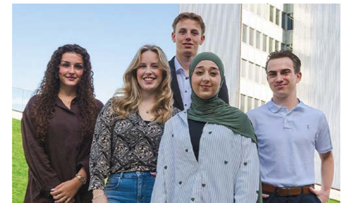
Die bwb investiert in die Ausbildung und bietet jungen Menschen gute Berufsperspektiven.

Seit 2023 dokumentiert ein Nachhaltigkeitsbericht das Engagement der bwb. Ab dem Berichtsjahr 2025 stellen wir unser Reporting vom Deutschen Nachhaltigkeitskodex (DNK) auf den VSME-Standard um. 2) Als Mitglied der „Initiative Wohnen.2050“ arbeiten wir im Netzwerk gemeinsam an wirksamen Klimaschutzlösungen in der Wohnungswirtschaft.